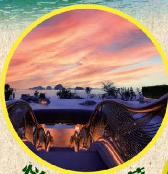
悅榕莊日落 下午茶