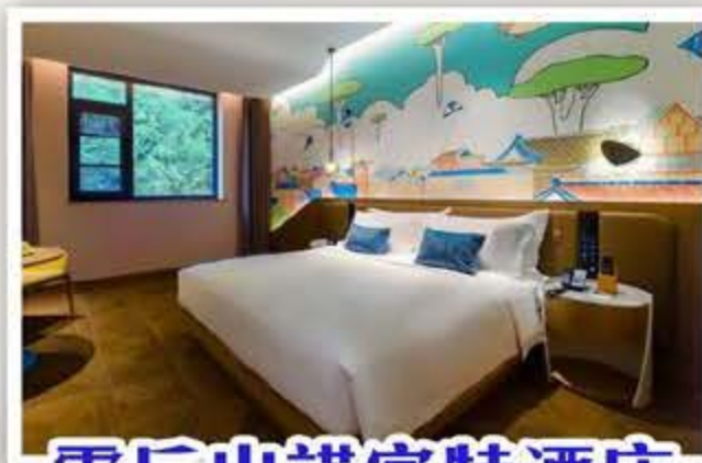
雲丘山諾富特酒店